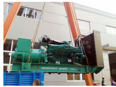
出口巴基斯坦 1200KW康明斯发电机组