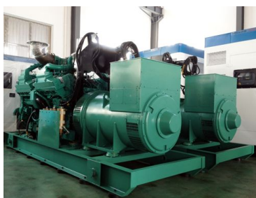
出口伊朗 1600KW康明斯发电机组