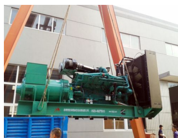
出口巴基斯坦 1200KW康明斯发电机组