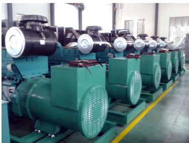
东南亚客户6台康明斯发电机组并机